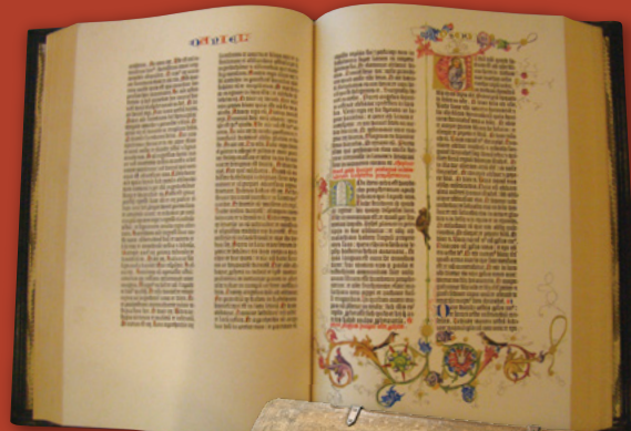
「グーテンベルク聖書」 (複製版)