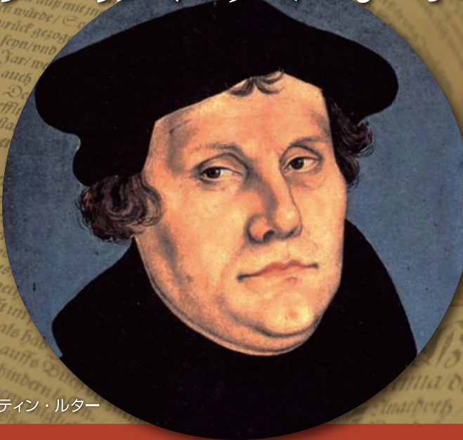
マルティン・ルター