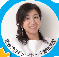
総合プロデューサー：平野裕加里

「ALS」という難病を知ってほしい もっともっと研究が進んでほしい 治る未来にむかって!!