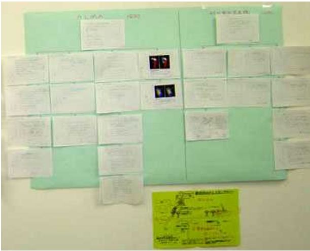
図3：フローチャート制作図