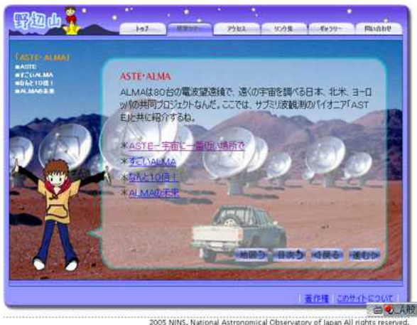
図 1 : 本システムのデザイン