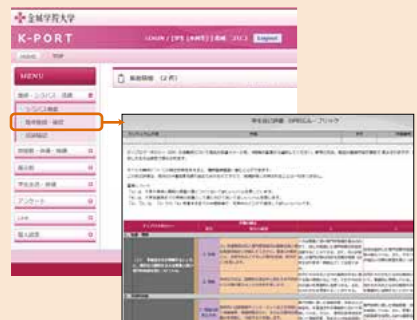
[ルーブリック評価画面]