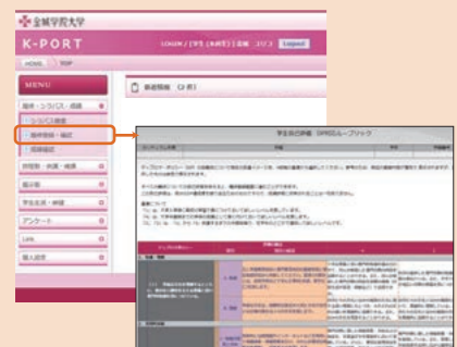
[ルーブリック評価画面]